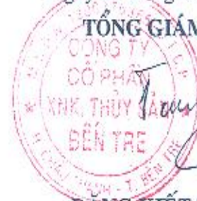
ĐẶNG KIẾT TƯỜNG